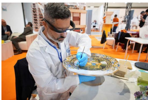
Salone del Restauro, Ferrara.

L'ingresso all'evento sarà gratuito, previa registrazione obbligatoria sul sito ufficiale www.salonedelrestauro.com