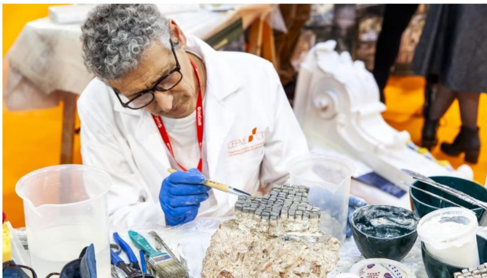
Un momento di una passata edizione

Edizione numero trenta per una manifestazione che valorizza i beni culturali