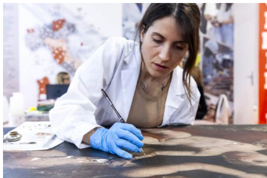
Salone del Restauro, Ferrara.

Non mancherà un'attenzione speciale alla salvaguardia dei beni danneggiati da disastri ambientali, tema di rilevanza globale in un periodo segnato dai cambiamenti climatici e da eventi catastrofici sempre più frequenti. La gestione integrata e sostenibile delle risorse sarà uno degli argomenti principali di dibattito, con un focus particolare sul recupero dei beni culturali in situazioni di emergenza.