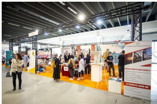
Salone del Restauro, Ferrara.