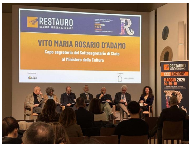
Restauro 2025 | Milano, conferenza stampa di presentazione della fiera

Dal 14 al 16 maggio 2025, il quartiere fieristico di Ferrara ospiterà una tre giorni straordinaria, rendendo la città hub internazionale per i beni culturali e ambientali. Per il suo trentesimo compleanno, Restauro avvalorata la sua posizione di primo piano, riconosciuta a livello globale e certificata secondo la norma Iso 25639:2008 da Isfcert – Istituto di Certificazione Dati Statistici Fieristici. L'evento, che si distingue per la qualità e la varietà della proposta espositiva e formativa, si trasformerà in un vivace spazio di confronto su tematiche d'avanguardia, favorendo la crescita del comparto attraverso un approccio innovativo e interdisciplinare al mondo del restauro.