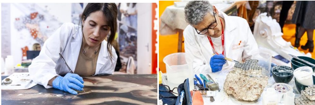
RESTAURO, il Salone Internazionale dei Beni Culturali e Ambientali, Ferrara EXPO, 2024.

compleanno, RESTAURO avvalora la sua posizione di primo piano, riconosciuta a livello globale e certificata secondo la norma ISO 25639:2008 da ISFCERT – Istituto di Certificazione Dati Statistici Fieristici”.