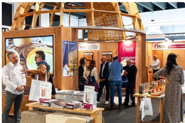
Salone Restauro Ferrara 2024