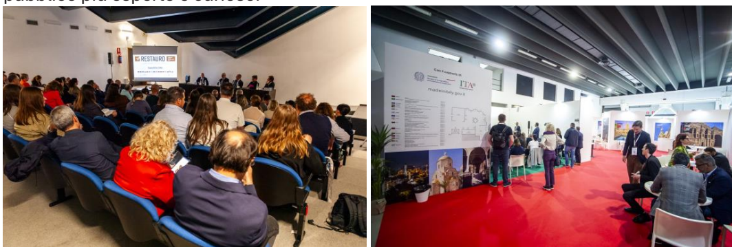
RESTAURO, il Salone Internazionale dei Beni Culturali e Ambientali, Ferrara EXPO, 2024.

Ulteriori novità sono il rilievo geometrico 3D globale del Colosseo , finora realizzato solo per singole porzioni o tematiche, presentato per la prima volta dal Parco Archeologico del Colosseo , “progetto rivoluzionario per la tutela del monumento, sviluppato con il contributo di imprese leader del settore, destinato a diventare un riferimento imprescindibile per studi, manutenzione, restauro e valorizzazione” , e nuove collaborazioni con le principali associazioni della filiera dei beni culturali. Infine, spazi espositivi, istituzionali e momenti seminariali di alto livello offriranno un'occasione unica di confronto e crescita e “faranno il loro debutto” nuove aree tematiche per catturare l'attenzione del pubblico più esperto e curioso.