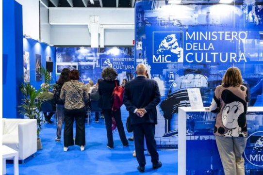
Salone del Restauro, Ferrara. Foto: Giacomo Brini