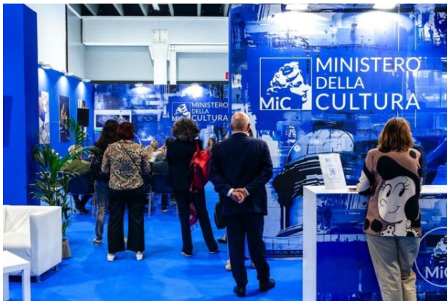
Salone Restauro Ferrara 2024

“Prendersi cura del patrimonio artistico e culturale significa assumersi la responsabilità di elaborare e porre in essere strategie di lunga gittata mirate a conservarne l'integrità, a restituirlo al suo antico splendore, a difenderlo dai rischi di natura ambientale, naturale o antropica in cui potrebbe incorrere nonché a promuoverne il valore presso un pubblico quanto più ampio possibile. È questa un'azione in cui il nostro Paese eccelle, affidata al sapiente lavoro di professionisti le cui competenze vengono richiamate a modello in tutto il mondo e che abbiamo il dovere di tramandare attraverso le nostre scuole di alta formazione. Il Salone Internazionale dei Beni Culturali e Ambientali rappresenta un'imperdibile occasione per ribadire l'impegno del Ministero per la tutela della nostra bellezza, storia e identità nazionale” .